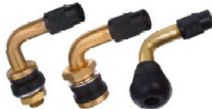
PVR30 PVR32 PVR70