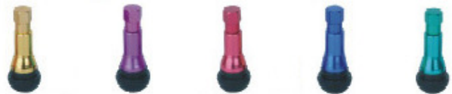
TR413AC-Y TR413AC-P TR413AC-R TR413AC-B TR413AC-G Válvulas Cromadas Coloridas