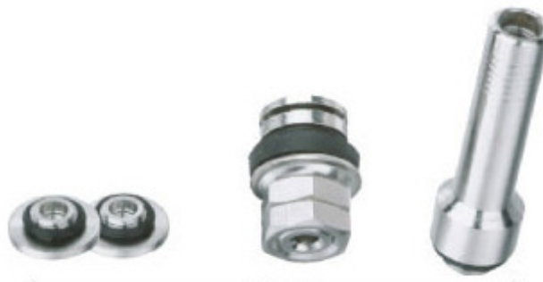
V - 008