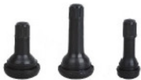
TR415 TR425 TR438

Válvula com Anel Duplo e Tampa Resistente ao Pó