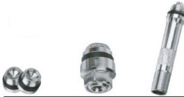
V - 008S