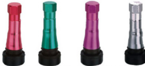
TR600HP-R TR600HP-G TR600HP-P TR600HP-C