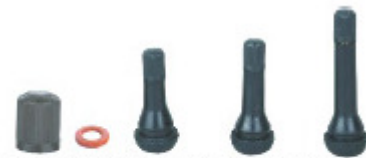
VC8-DC TR413 TR414 TR418

Válvula Tipo Alemã com Duplo Anel e Tampa Resistente ao Pó