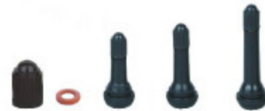
VC8-CL TR413 TR414 TR418

Válvula com Anel Duplo e Tampa Resistente ao Pó