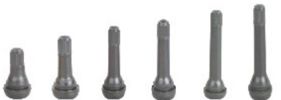
TR412 TR413 TR414 TR414L TR418 TR423

Resistentes a frio, altas temperaturas e ozônio