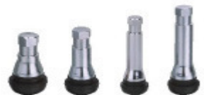
TR412AC TR413AC TR414AC TR418AC Válvulas Totalmente Cromadas