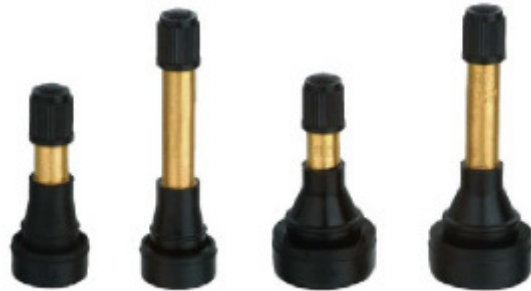
TR600HP TR602HP TR801HP TR802HP