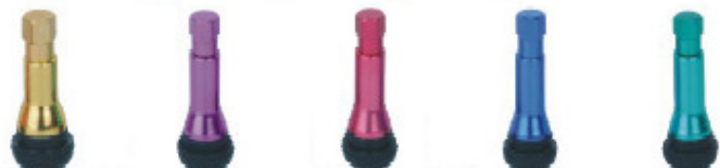
TR414AC-Y TR414AC-P TR414AC-R TR414AC-B TR414AC-G Válvulas Totalmente Cromadas e Coloridas